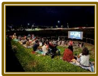
昨年の上映会写真

上映作品: ハルをさがして 日 時: 令和2年11月6日(金) 18時～20時 会 場: 文化情報センター裏手 内海テラス ／雨天時 恩納村博物館ロビー 対 象: 児童、一般 定 員: 先着50名